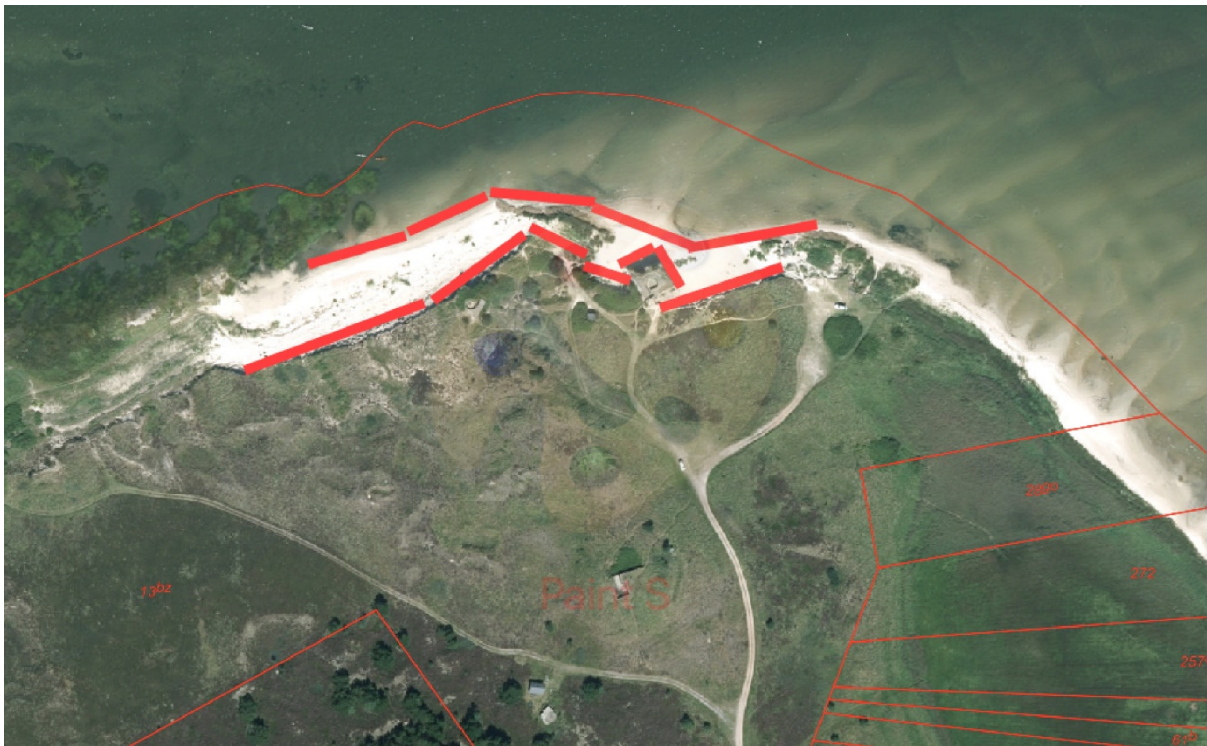
Figur 1 - Oversigtskort

På figur 1 vises en oversigt over kystbeskyttelsen.